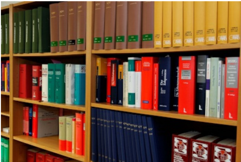
Publikationen nach Jahrgang