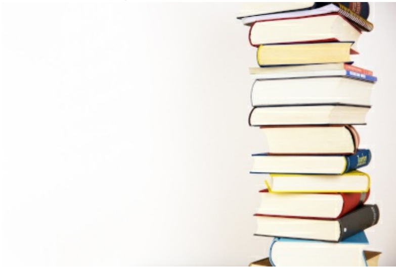
Beiträge in Fachzeitschriften